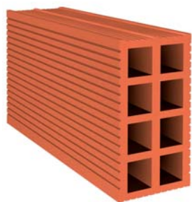
[ hueco doble ]