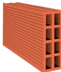
[ machetón ]