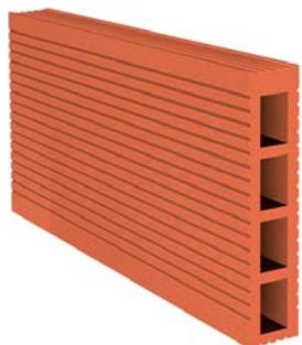
[ tabique ]