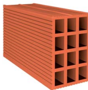
[ hueco triple ]